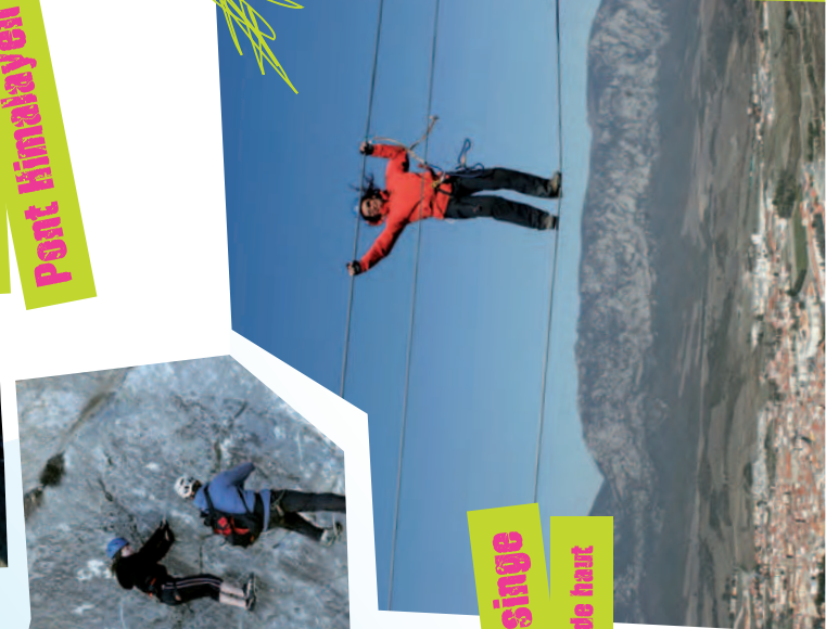
Pont de singe à 30 m de haut